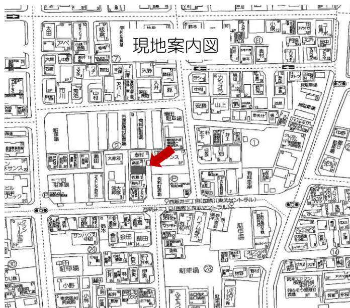
図面と現状に相違がある場合は、現状優先といたします。